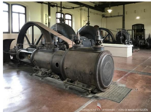
FONDAZIONE CA' VENDRAMIN - FOTO DI MAURIZIO TEZZON

Sulla strada del rientro in albergo, sosta al Museo della Bonifica che si trova nell'ex impianto idrovoro di Ca' Vendramin, dismesso verso la fine degli anni sessanta del secolo scorso. Il museo illustra l'azione svolta dall'attività di bonifica con il prosciugamento di paludi e acquitrini per rendere vivibili aree in continuo equilibrio tra terra e acqua e consentire lo sviluppo economico del Delta. Prima